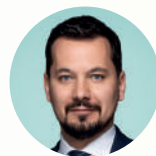
Juraj Šeliga spravodlivosť a vnútorná bezpečnosť

Prokuratúru zmeníme tak, aby generálny prokurátor nebol neobmedzený pán, ktorý zmarí akékoľvek vyšetrovanie. Preto stačilo §363! Zároveň, zavedieme náhodné pridelenie spisov prokurátorom, aby sa obmedzil „zásah zhora“. Polícii vrátime vážnosť a rešpekt. Zametači pod koberec do policajného zboru nepatria. Tí, ktorí robia svoju prácu aktívne a stoja na strane občanov a zákona, musia to pocítiť aj na svojej výplate a benefitoch. Je načase dokončiť elektronizáciu na súdoch a stanoviť minimálne časové lehoty na rozhodnutie. Nie je možné, aby sudca nerozhodol 10 rokov, aj keď môže, a necítil žiadnu zodpovednosť. To je predsa výsmech spravodlivosti a občanovi.